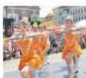
FESTIVAL KMOČŮV KOLÍN letos nebude.

Střední Čechy - Mezi oblíbenými festivaly dechové hudby v České republice. Každá města rozhodla o zrušení 57. ročníku festivalu. Jedná se o třetí zrušený ročník v celé historii tradice. K přeměnění tradice festivalu došlo zatím jen v letech 1964 a 2005.