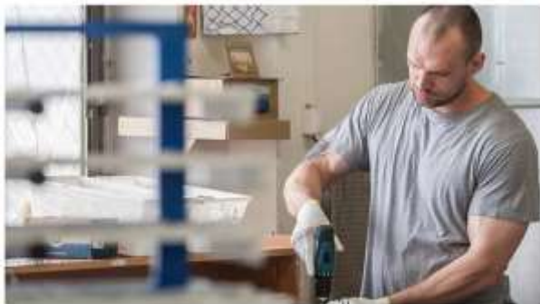
Wastroční foto.

Trable podniků i jejich zaměstnanců, které přináší nynější doba spojená s řadou omezení kvůli šíření koronaviru, má pomoci zmírňovat „půjčování“ pracovníků mezi firmami navzájem.