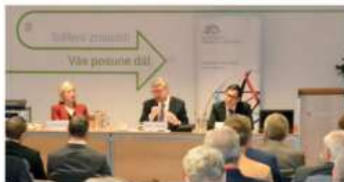
O setkání s vicepremiérem Havlíčkem byl mezi jihomoravskými podnikateli značný zájem.