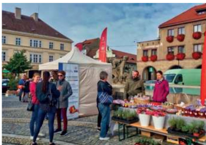
Mělnický řemeslný jarmark přilákal na mělnické náměstí desítky návštěvníků, kteří si mohli vystavené výrobky regionálních podnikatelů zakoupit a podpořit tak místní podnikání.