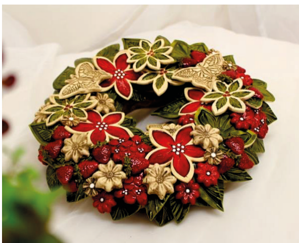
Cena: 1200 Kč